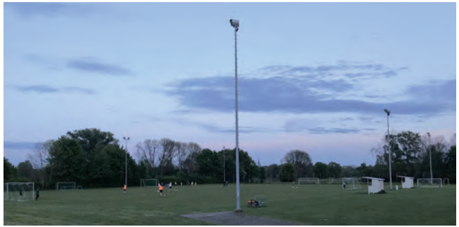
Die alten Strahler sollen ausgetauscht werden

Erfreulicherweise wird die Finanzierung durch die