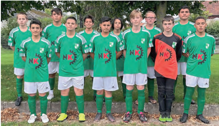
„Team Jahrgang 2010“

Fußballerisch entwickelte sich die Spielzeit sehr schwierig, da wir ständig Personalprobleme hatten, so dass wir teilweise ohne Auswechselspieler antreten mussten. Verletzungsspek, Ramadan, Schüleraustausch oder lange Schultage machten es fast die gesamte Rückrunde unmöglich, in ganzer Teamstärke zu trainieren. Die Folge ist eine sehr durchwachsene Rückrunde, in der wir ständig ein