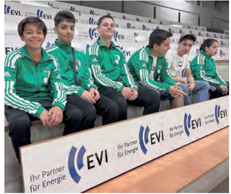
„Als Zuschauer bei den Handballern“